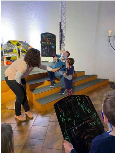
Die Kinder erklären ihre Bilder