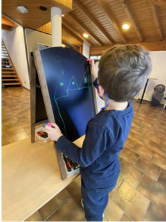
Vier Kinder malen, was Gott Ihnen aufs Herz legt