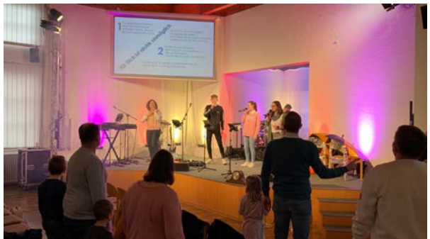
Da haben wir gefeiert und es ging richtig ab! „Wow, voll coole Lichter! Und Nebelmaschine!“