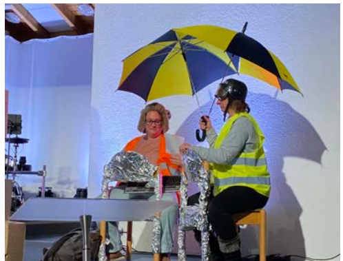
Die Zeitreise beginnt -> es geht nach Jericho