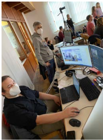
Unsere super Techniker